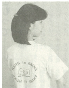
バックプリントのTシャツ

などが披露されます。今年は特に「チビツ子向けに「ドラゴン特急」(写真右上)を二日間走らせま