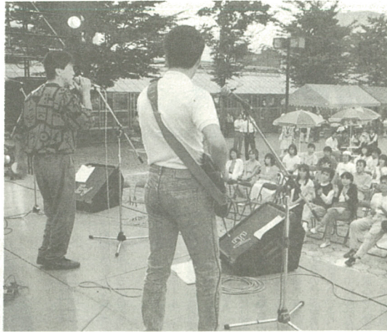
若い情熱がほとばしるライブ演奏(五年の祭典から)

「青年の祭典(YOUTH・IN・EBINA)」が七月二十二日、二十三日の両日、海老名中央公園で開催されます。この祭典は国際青年の年を機に始まり、今回で五回目。この祭典の目的は、青年たちが団体活動やボランティア活動を通して、新しいコミュニティの創造と意識の高揚を図ることです。