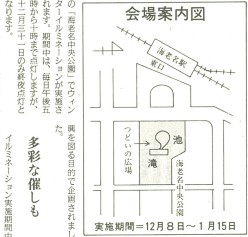
実施期間=12月8日~1月15日

十二月八日(金)から来月一月十五日(月)までの三十九日間にあたり、海老名駅東口前