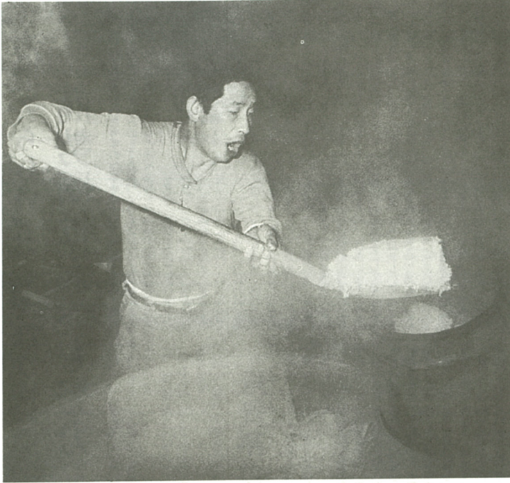
蒸米・大釜で蒸した米を桶ですばやく運ぶ作業が始まり、酒倉は緊張感に包まれる

編集・発行 海老名市役所広報広聴課 〒243-04 神奈川県海老名市勝瀬175 ☎ (0462) 31・2111