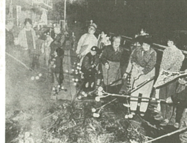
市内各地で行われている「せいと焼き」

海老名では訛って「せえの神」と呼ぶ。市内の各所にある「せえのかみぞ」といふのは「せえの神の所」である所という意味で、「所」は「せ」といふ意味で、「所」は「せ」とも読む。現に隣の大和市には「公所」といふ集落があるが、黄泉の国には、頭毛がなくて目がひとつの厄神がいて、毎年十二月八日の晩にやってくるというので、「八日僧」といいうのが、八日僧はその晩のうちに村中を回って戸毎に人口調査をし、翌年疫病であの世へ連れていく人間の名簿を作った。これを道祖神に預け、一月十五日に受け取りに