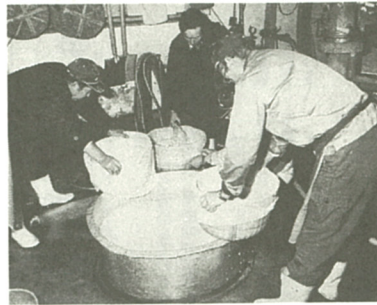
洗米・作業は1秒の狂いもなく行われる