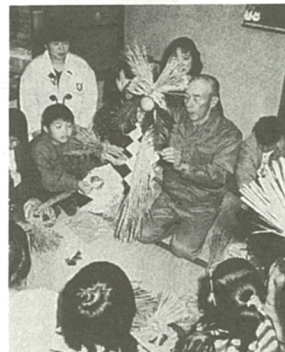
まもなく完成!立派なしめ縄飾り

ハなをまつけること、市販のものにも負劣りしない出来栄えに、僕が作ったしめ縄を交関に飾るんだ」と、子供たちは得意げに話していた。