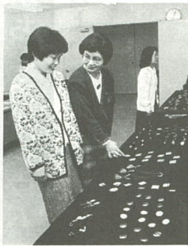
年々完成度が高くなる作品群(展示部門)

など大好評。催し物部門では、厚木東高等学校生徒による人形浄瑠璃が演じられたほか、アニメ映画「魔法の宅急便」の上映や、パソコンコーナーなどが子供たちに大人気、約七千八百人、楽しいひとときを満喫。