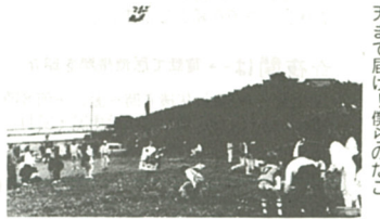
天まで届け!僕らのた〜

五月二日、在日ドイツ民主共和国(東ドイツ)の子供たちとその母親二十九人が中河内の観光農園を訪れ、海老名産のイチゴ摘みを行った。