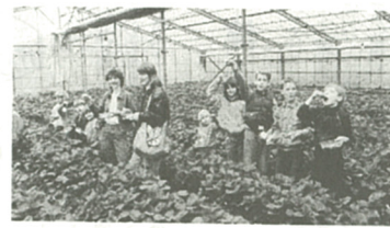
「トモオイシイ」を連発(尾上農園)

伝統的な相模だこを上げる「親子で揚げ大会」が、四月二十九日、中野多目的広場で行われた。