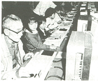
パソコンにワシも挑戦!

四月二十一日、二十日の両日、市中央公民館を主会場とした「第八回公民館まつり」が行われ、公民館を学習の場として利用している六十一団体が、一年間の成果を発表した。