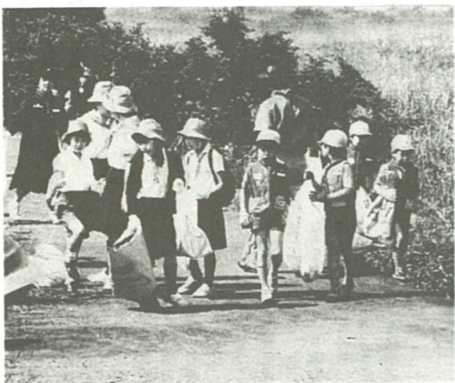
美化キャンペーンでは毎年約18トンのごみを収集

5月27日 中野水管橋付近で 相模川の水質改善を目的とした美化キャンペーンが五月二十七日(日)午前八時から九時半まで、中野の横須賀水道局の水質調査所から門原橋の戸次橋までの相模川河川敷で行われます。小雨決行、雨天の場合は六月三日(日)に延期します。 主催は、県央地区行政センター、海老名市、市美化運動推進協議会と自治会や各種団体などです。 参加者は、午前八時から、河川敷のごみを各自で拾い集め、九時までに集合場所の中野多目的広場南側にお集まりください。集合