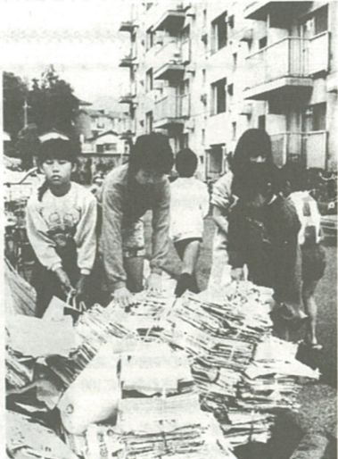
みんなで集めた新聞紙の山

次のようになっています。 【対象となる団体】 奨励金の支給対象は自治会、PTA、子ども会などの各種団体で集団資源回収を定期的に実施しているか、または実施しようとして、市に登録された団体です。 登録は美化衛生課で受け付けています。 【集団資源回収の方法】 市に登録した廃品回収業者(三十九業者)に売却し、業者から仕切票をもらってくだ