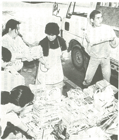
みんなで協力して回収(いちごき子ども会)