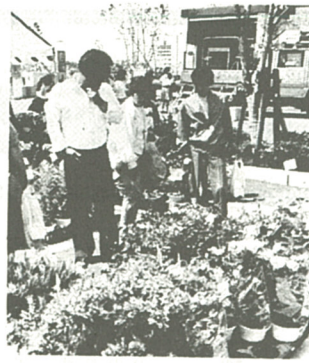
苗の即売も人気の的

会場ではサツキの苗木、花の種子、園芸用土の無料配布や、植木市、盆栽展などが行われたほか、アトラクションのミニS.L.乗車会、今泉・大谷両中学生による吹奏楽の演奏、起震車体験乗車も行われ、人気を呼んだ。