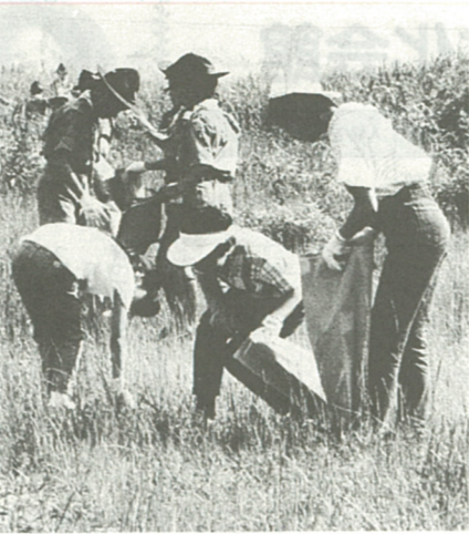
河原に捨てられたごみを熱心に拾う子供たち

相模川美化キャンペーンは、昭和五十五年から関東地域で統一的に毎年実施されていますが、海老名市だけでも、毎年十、八、前後のごみが収集されています。 私たちの生活に欠かせない飲み水は、豊かな自然からの湧き水で、川の川に散らすごみを回収してより美しい環境を整備し、きれいな水を確保しましょう。 多くの皆さんの参加をお願いします。 問い合わせは美化衛生課内(51)へ。