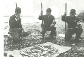
試し釣りで釣り上げられたアユ

六月一日のアユ解禁を前に、今年初の釣果を占う試し釣りが五月二十一日、戸沢橋下の相模川で行われた。