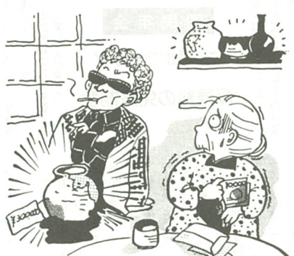
訪問販売などによる悪質商法についての相談も多い

私は、相談をうけに来た方の話をすべて聞いたあとに、自分の体験や世間の実情を照らし合わせてアドバイスをしています。