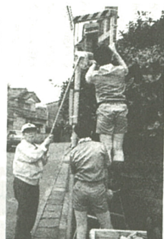
交通安全のためにカーブミラーを清掃

今年で十九回を数えるこの運動会は、お年寄りが自ら企画運営しており、競技種目の選定から用具係、賞品係などの役割も会員が分担した。競技出場者は、地区名を入れたゼッケンを付け、大玉ころがしや綱引きなど十三種目に心地良い汗を流していた。