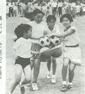
楽しいゲームに思わず笑顔が...

五月十三日、社家小学校グラウンドで「南地区子どもふるさとまつり」が開かれ、約三百六十人の親子がゲームで楽しいひとときを過ごした。