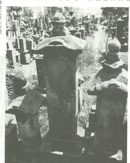
海源寺の本堂裏にある日朝上人の墓

中新田の海源寺の開山は、日朝上人である。上人は延暦十九年(四二三年)に伊豆の国に生まれ、長祿三年(四五九年)には三島と鎌倉の二つの本覚寺住職を兼務。その後寛正三年(一四二二年)、空門の希望にこたえられて、日蓮宗総本山身延山久遠寺第十一世の法主になられた。上人が身延入りされる一、二年前のことであつた。かねがね愛甲郡飯山村(厚木市)の金剛寺に一切経が保存してあるのを耳にした上人は、鎌倉と飯山の間を往復してはそれを究めておられた。