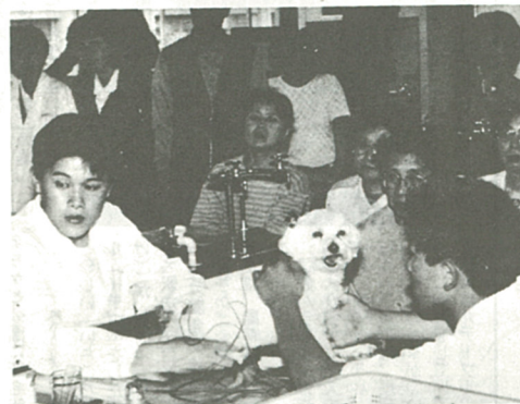
ワンちゃんも針をうたれて気持ちよさそうな表情に

市民中央公民館では、五月二十六日、県立中央農業高校を会場に「自然派実用講座」を開催し、ペットや家畜の鍼灸法を行いました。