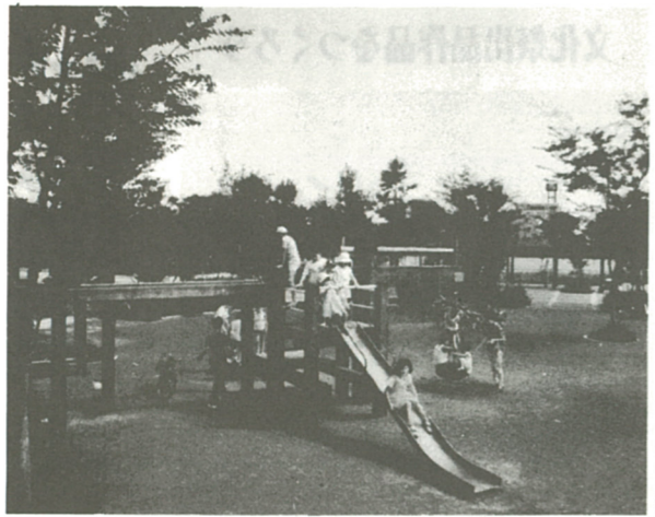
調査票は公共施設整備の資料にも...

国勢調査は、赤ちゃんからお年寄りまで、日本に住んでいるすべての方が対象となります。九月二十三日から三十日まで、調査員が世帯ごとに調査票を配布します。アパートなどに一人暮らしの方や下宿している方は、未成年でも学生でも世帯主としてご記入ください。