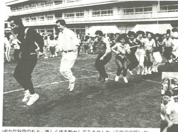
やかな秋空のもと、楽しく体を動かしてみませんか(去年の市民レク)

平成二年産産老若市民レクリエーション大会が、十月十七日から十四日にかけて、市内十会場を回り、市民レクリエーション大会を開催されました。市民レクリエーション大会は、市民のみなさんがいっそう健康や体力の増進に努め、明るく住みよい地域社会づくりに寄与することを目的に行われるもので、