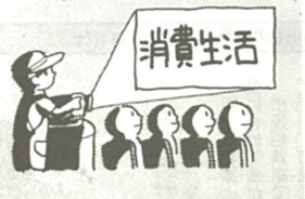
放映は2階ホールで

また、ニチイ海老名店2階のアメニティ・ホールでは、9月29日、30日の両日に限り「16」映画コーナー」を設けます。このコーナーでは、火災や大地震が発生したときの対処、食品添加物や台成洗剤の安全性、などを考える映画を上映します。>問い合わせは商工課(内512)へ