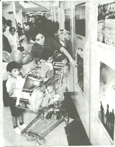
「生活に役立つ」と毎回好評の消費生活展

今回の消費生活展では、私たちの暮らしと環境破壊の関係を考えます。「昔に比べ、今は物が豊富...」