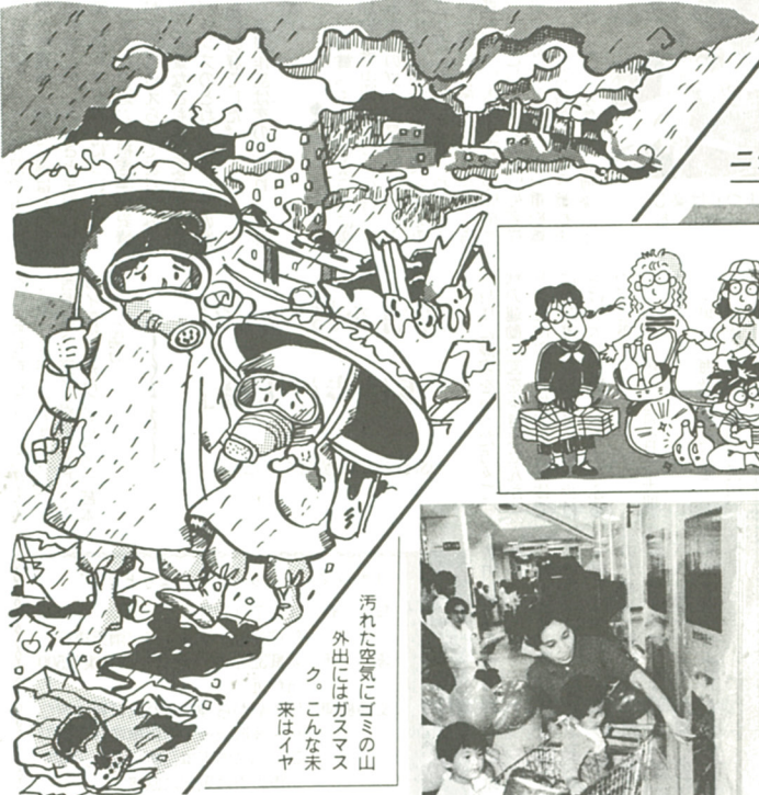
汚れた空気にゴミの山 外出にはガスマスク。 こんな未来はイヤ