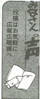
投稿はお気軽に 広報広聴課へ

「かみこ」創生が叫ばれて久しいが、私のイメージでは、町の中心に何かのシンボルがあり、その周辺を生活空間が囲み