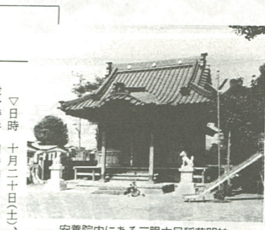
安養院内にある三眼六足稲荷明神

午後二時から、郷土かるたの河原口コースを親子で歩き、海老名の歴史を学びましょう。