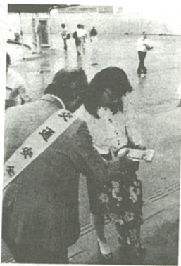
街頭で交通安全を訴える

九月十七日、海老名駅東口で交通安全を訴える街頭キャンペーンが行われ、市交通安全対策協議会の役員など二十九人が、