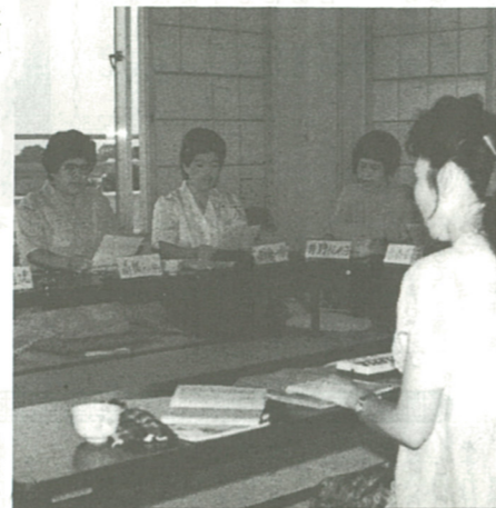
こぶしをつけての感情表現は難しい

市中央公民館では、五月十日から十月四日まで、十五回にわたって「詩吟」の講座を開講しています。