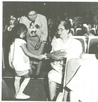
カーネーションのプレゼントに思わず笑顔が

「いままでもお元気で」という園児のあいさつに、目を細めて喜ぶお年寄りたち。その後、落語やマング語や演芸を楽しんだお年寄りたちは、「また来年が送迎バスで、それれ帰路に