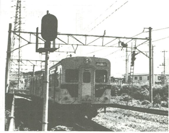
架線工事も終わり、来年3月の電化開業を待つJR相模線

平成元年三月に始まったJR相模線の電化工事は、順調に進み、来年三月には電化開業される見込みで、十月十九日から架線への送電が開始されます。