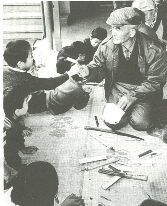
豊かで楽しい老後を(世代間交流で子供たちに竹とんぼ作りを伝授)