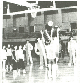
熱気にあふれた実技講習会

今年のお米を使った料理講習会を受けた後、受講生はさっそくお米を使った大巻きずしに挑戦。初めはとまどいが多かったが、慣れるに従い次々と立派な太巻きずしを作り上げていた。