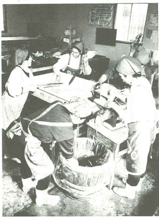
機械(右)でミンチ状にされたみそは下のたるに詰められる