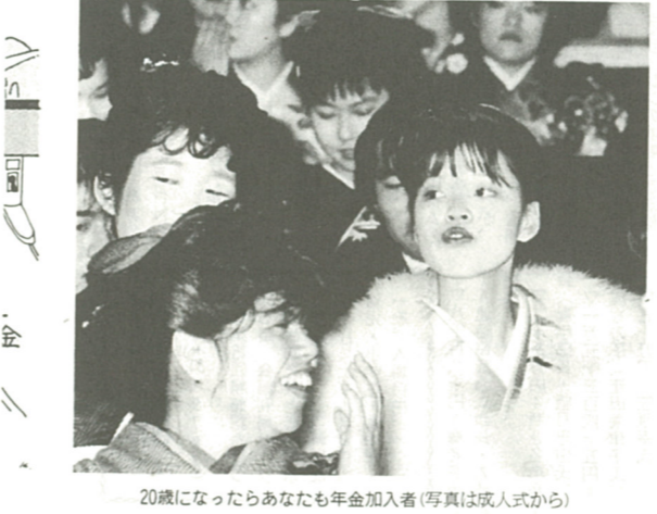
20歳になったらあなたも年金加入者(写真は成人式から)

20歳になったら国民年金 二十歳になると成人として多くの権利が認められますが、それと同時にいろいろな義務が生じます。国民年金に加入する(とよめる)の二つ、社会人としての第一歩です。