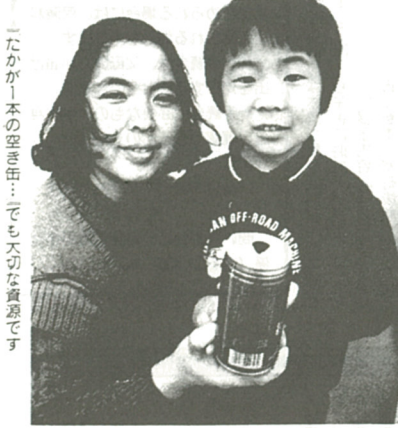
「たかが一本の空き缶...でも大切な資源です」

びんの日 と新設 みなさんの家庭から出るごみの中には、空き缶、古新聞、空きびんのように、資源として再利用できるものが数多く含まれています。こうした資源をむだにしないため、市では四月一日から「資源分別回収」を実施します。