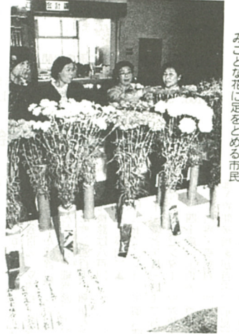
みこな花に足をのめる市民