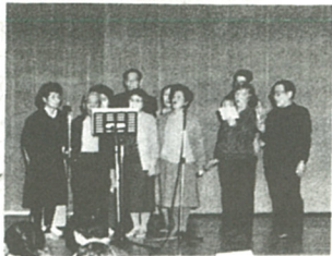
合唱も息がぴったり!

当日は、同連合会福祉部が、司会、進行、音響などすべての運営を行った。演目は、民話、カラオケ、踊りなどが多かったが、詩吟やハーモニカの演奏もあり、それぞれに日ごろの練習の成果を十分に発揮した。 演技が終わる度に、場内からは大きな拍手と歓声が沸き起こり、和気あいあいとした雰囲気の中で、参加者は地域を越えて話をはきませる楽しい一日を過ごしていた。