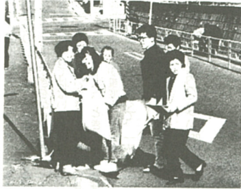
みなで「まち」の美化運動にひと役

清潔で美しい環境を保ち、美化意識の高揚を図って、二月二十四日、国分寺台一丁目から五百十目の住民約四百人が同地区の美化キャンペーンを行った。 自宅を午前八時半に出た各参加者は、道路、公園などのごみを拾い集めながら次々と大谷小学校に集合。一時間で約四百五十kgのごみを収集した。ごみは、空き缶、空きびんが多かったが、