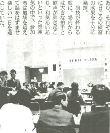
市長、教育長らをつまみ真剣な議論が...

芸大会」が、三月四日、市総合福祉会館で行われ、約二百人が参加した。この演芸大会は、各地区の老人クラブ会員相互の親しくと交流を深めようと、昭和五十七年から年に三回ずつ実施しているもの。