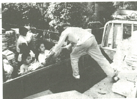
子供たちもお手伝い