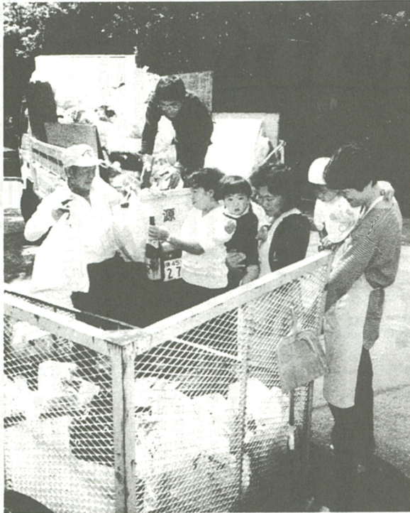
「缶と紙と布の日」「びんの日」にはごみ集積所から資源が回収されます

編集・発行 海老名市役所広報広聴課 〒243-04 神奈川県海老名市勝瀬175 ☎ (0462) 31-2111