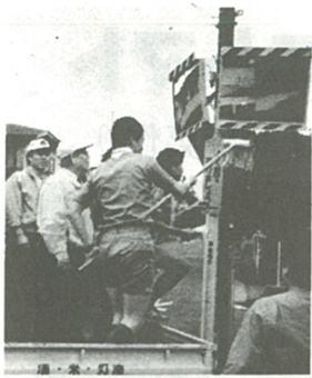
約870本のカーブミラーを清掃

が実施した。当日は、午前九時に同クラブ、飛鳥ライオンズクラブ、ボーイスカウトのメンバーなど九十八人が市役所に集合。自動車に洗剤やモップを積み、六、七人のグループに分かれて市内にある