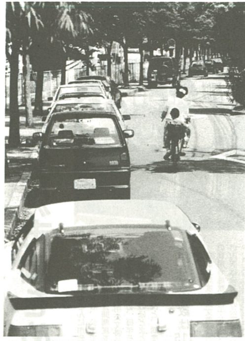
路上駐車は交通事故の原因に (さつき町)