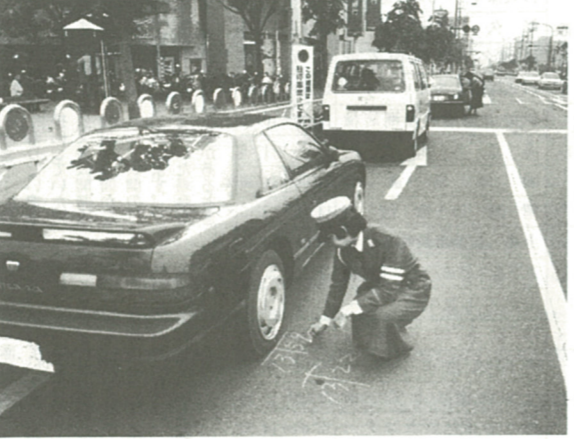
違法駐車は交通の妨げに (海老名中央公園前)