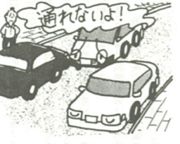
「車庫はないが車欲しい」

車庫法の改正で、自動車の保有者は、自宅から2.5以内の自動車の保管場所を確保しなければならなくなります。そして、七月から新規に自動車を購入した場合、保管場所が確保されているかどうかを明示するために、保管場所標章を自動車の後部窓ガラスに表示する