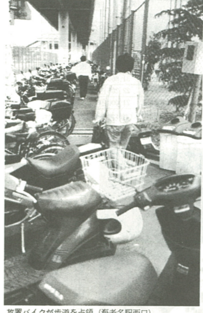
放置バイクが歩道を占領 (海老名駅西口)

三月の定例会議で可決されたもので、七月一日から海老名駅周辺の放置禁止区域(下図参照)に放置されている原動機付自転車は撤去されることになりました。この自転車条例の改正に伴い、市では海老名駅東口と西口に合計約六百五十台が駐車できる有料原動機付自転車駐車場を建設します。東口駐車場は、六月下旬に、また西口駐車場は、七月下旬にそれぞれ完成する予定です。なお、駐車料金は一月二千円、東口駐車場は一日だけ