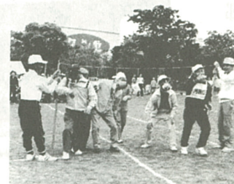
思わず手を使ってしまおう選手も...