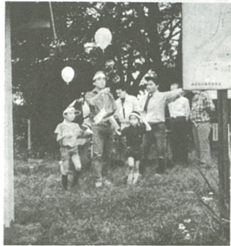
さて、次のチェックポイントは...

が実施した。当日は、午前九時に同クラブ、飛鳥ライオンズクラブ、ボーイスカウトのメンバーなど九十八人が市役所に集合。自動車に洗剤やモップを積み、六、七人のグループに分かれて市内にある