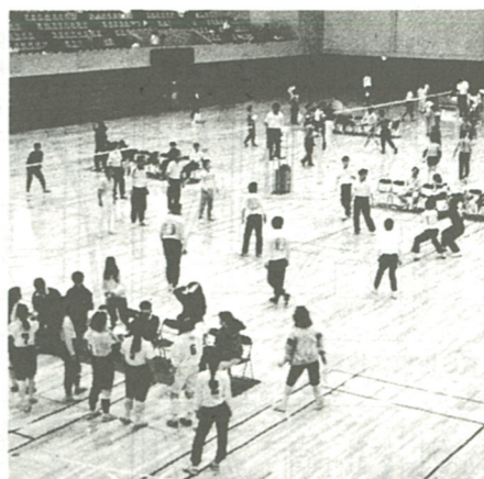
去年の同大会バレーボールの部から(総合体育館で)

第七回市民総合球技大会(7月20日)バレーボール、バドミントン)が次のとおり開催されます。 ○ソフトボール 九月八日 (日) 市総合体育館 (日) 市総合体育館 ○バドミントン 十一月二十 (日) 市総合体育館 ○バドミントン 十一月二十