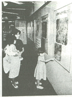
お母さん、私の家はこの辺?

限られた県土をいかに保全し、適正に利用するかをテーマにしたパネル展「みんなで考えよう 神奈川の土地」が七月三日から五日間、二子イモ老名店文化ホールで開かれた。県主催の同会場には、航空