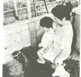
ターちゃん早く元気になって!

写真で見ると県央八地域の交通や人口・地価の推移を示したパネル、土地利用現況地図など計二十九点が展示された。特に注目されたのが、約三十年前と五年撮影した海老名駅前航空写真で、二枚の写真を比較した女性や子供たちが「昔と比べると同じ場所とは思えないほど建物が増えている」「昔も今もおじいちゃんの家が写っている」といった感想が聞かれた。