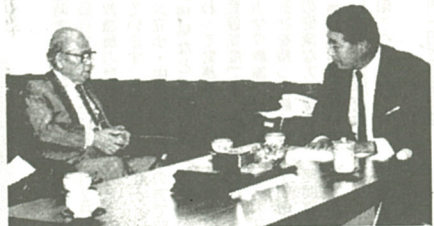
防衛行政務次官(右)にNLP中止などを要請する市長(7月10日)