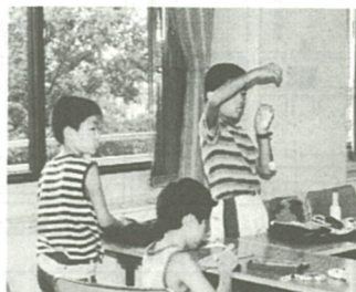
作る楽しさを体験(去年の同まつり)

会と同じ学年の友達同士で参加すると、作った作品がいろいろな活動の場で役に立ちます。お母さんでも興味のある方は、参加してください。