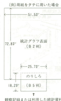
観察記録または利用した統計資料

県統計協会では、統計思想の普及向上を目的に、統計グラフコンクールを次のとおり開催します。 ▽応募資格 県内在住または在学(勤)の高校生以上の方 ▽課題 自由 ▽グラフの大きさ 七十二・八センチ×五十一・五センチ(B2) ▽応募先 各市区町村教育委員会(〒240 勝浦市教育委員会) ▽締め切り 九月一日(金) ▽応募上の注意 ①作品は自分で制作したものに限る ②作品の裏面には、表題、住所、氏名、年齢、性別、職業(学生の場合は学年、学年)、電話番号を明記。氏名、学校名には必ずフリガナを ③観察記録または利用した統計資料は、十五・七センチ×十八・二センチ(B5型)の用紙に記入し、作品の裏面にのりつけする(上図参照) ④統計資料の出所、時点をグラフ上に明記する ⑤応募点数に制限はありませんが、二枚以上になつたものは認められません ⑥佳作は二名以内 ⑦入選発表 九月下旬予定 ▽その他 入選作品の著作権は県統計協会に帰属 ▽問い合わせ 海老名市役所企画課(内)へ