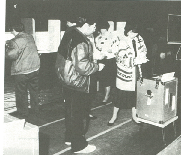
投票は政治参加への第1歩です

投票所入場整理券は、はがきで郵送します。裏面に三人分の入場整理券が印刷してありますので、切り離して、ご自分の券を投票所へお持ちください。なお、入場整理券をなくした場合は、投票所へお持ちがなかつた場合は、投票所での旨を申し出ていただくこととなります。