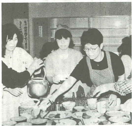
心をこめて作った料理に「おふくろの味、再発見