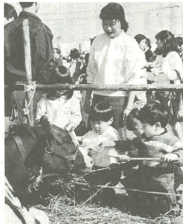
会場では牛の頭もなでられます