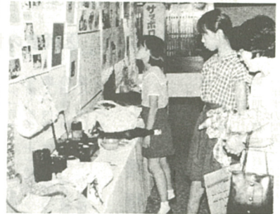
写真や木工製品など2000点を展示

海老名市をはじめとて、今年で十六回目。授産施設や地域作業所などから、施設での訓練や生活の様子を伝える写真と、絵、習字、陶芸、木工製品など約二千点が出品された。会場では、展示された作品の前で、熱心に見学をする人の姿が目立った。