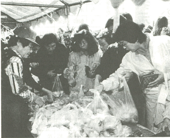
新鮮な野菜を求める市民 (去年の産業まつり)