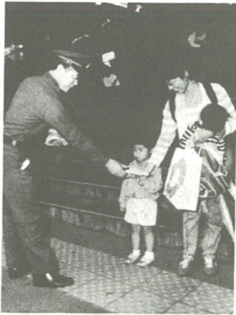
交通安全を心掛けてチラシを配布

「考えよう我が家の食生活と健康」をテーマに、九月二十七日から二十九日までの三日間、ダイエー海老名店で「第十二回みんなの消費生活展」が開かれ、約一万二千人が訪れた。会場には、子供たちの食事と健康」など、テーマに即したパネルが展示されたほか、市内八つの消費者団体が日ごろの研究