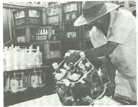
そのまま再利用できるびんは、ひもで縛って

「スプレー缶の中身が入ってこない場合は、こうした細かいな仕事は必要ないので、爆発の危険があるので、一個ずつ穴を開けていますが、中身が飛び散って塗料などが衣服についてしまったことも度々あります。」 また、びんを拾って再資源化するときは、せとものや蛍光灯、電球などの破片が混ざっている、再生ガラスの品質が低下して、ときには新しく作ったガラスがすべて使えなくなることもあります。せっかく出された資源を無駄にしないため、選別作業は念入りに行われています。また、「市民のみならず一人ひとりが資源の出し方を守ってくださると私たちの作業もはかどります。資源を今以上に生かすことができるのですが、という声が大げい組員から聞かれました。」 ▼市では、資源回収を推進するため十月一日から一貫回収の日（毎月四回）を増やします（4・5面に関連記事掲載）