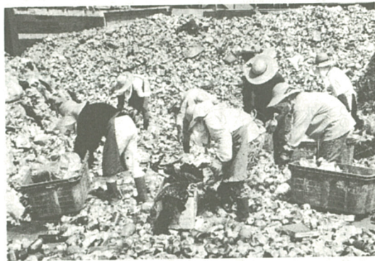
おどろく程多くの缶が...

猛暑の中、空き缶の「山のふもと」で手作業の選別作業を行っているのは「資源分別回収組合」のみなさん。廃品回収業者など6社で結成された同組合は、「資源回収事業」がスタートした平成三年四月以来、市内のごみ集積所に置かれた資源を回収し、その中の「缶類」と「びん類」を大谷にある選別場に搬入して選別作業を行っています。今回は、みなさんの家庭から出された「缶類」「びん類」が、その後どのように資源化されているのか、その実態を紹介いたします。