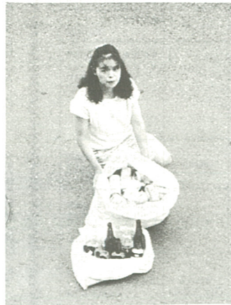
缶とびんは一緒にしないで