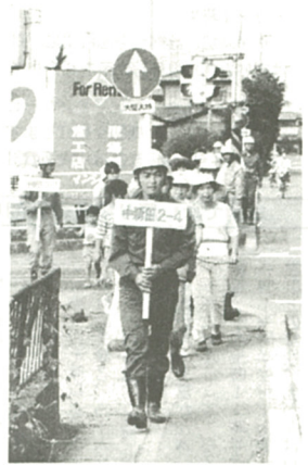
避難誘導訓練に参加する市民

駿河湾沖を震源とする大地震が発生したとの想定で、九月一日中新田小学校グラウンドで総合防災訓練が行われた。総合防災訓練は、広域避難場単位に巡回する形で行われており、今年の訓練区域は、中新田自治会、えびな団地自治会、訓練には、自治会、医師会、消防団員など九団体が参加し、避難誘導訓練や自主防災組織消火