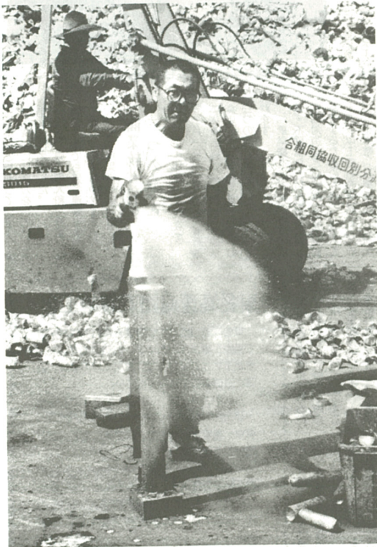
スプレー缶の穴開け作業。「プシュー」という音とともに、中身が勢よく周囲に飛び散る