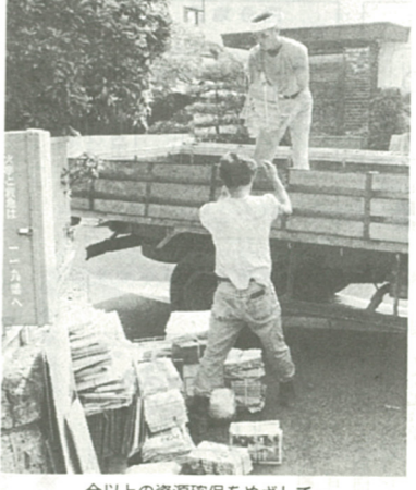
今以上の資源確保をめざして...

「資源回収事業」は、ごみの減量化と処理経費の節減、地球資源の保護とエネルギーの節約などを目的に行っています。