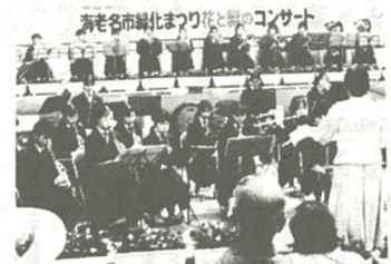
コンサートで春の一日を満喫

☆肥料・黒土プレゼント(適宜に配布します) ◎ミニSL乗車会 ☆花のさとづくりコーナー ☆ポスター展などが行われます。