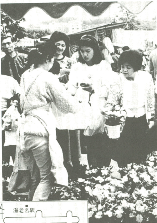
春の花に人気が集中…(去年の緑化まつり会場)