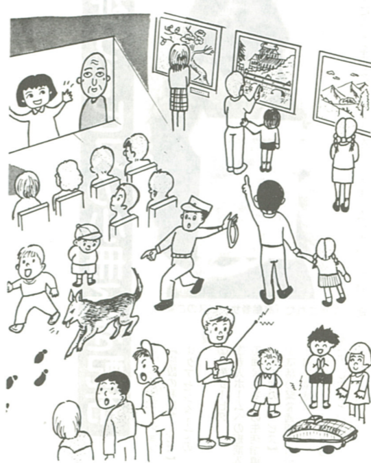
真心のこもった力作が勢ぞい