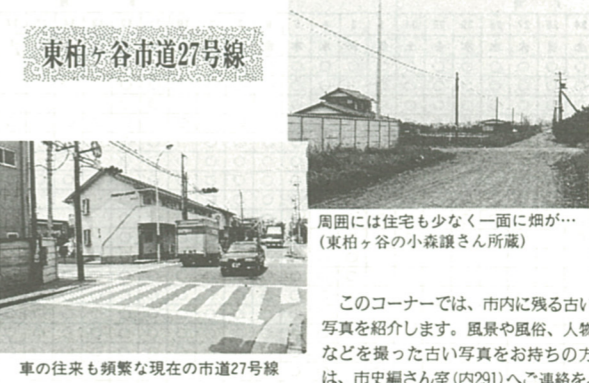
東柏ヶ谷市道27号線

このコーナーでは、市内に残る古い 写真を紹介します。風景や民俗、人物 などを撮った古い写真をお持ちの方は、 市史編さん室(内291)へご連絡を。