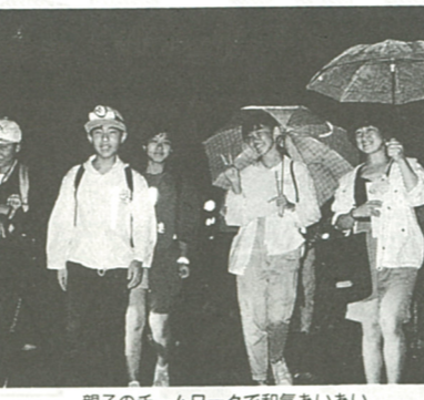
親子のチームワークで和気あいあい