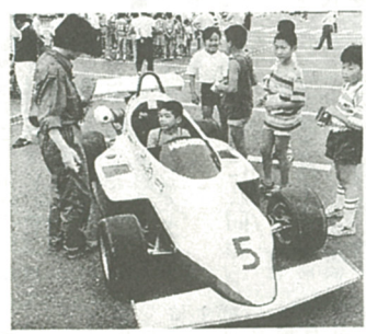
フォーミュラカーも登場!