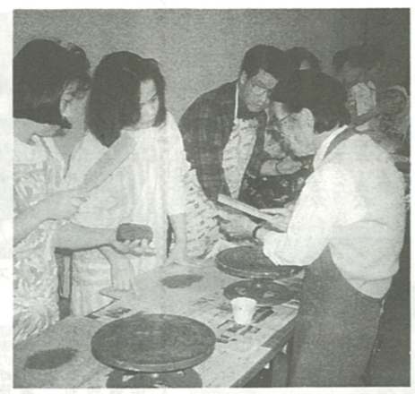
講師の作業を熱心に見入る受講生