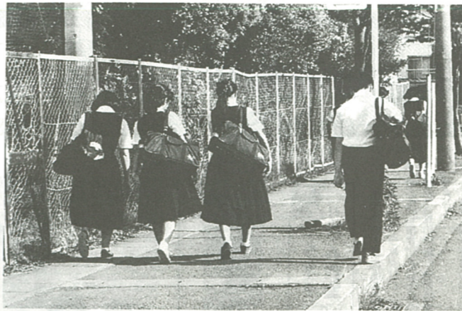
あたたかく成長を見つめて(本文と写真は関係ありません)

非行防止に関する相談を受ける 時、健全育成を図るための業務 を行います。 平成四年度の相談件数は、二 百五十四件で、その内訳は家族 関係、不良交友、登校拒否、進 路、性の悩みなどでした。