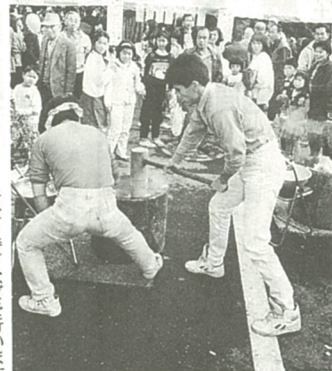
会場では「もちつき大会」も...

【低公害車モデル都市フェア】会場には、電気自動車やメタノール車などの低公害車の展示をするほか、ミニローラーカー教室(午前10時と午後1時から)の2回開催、低公害車クイズ大会(正午・午後1時)や電気自動車試乗コーナー(午前10時～午後3時)などを行います。