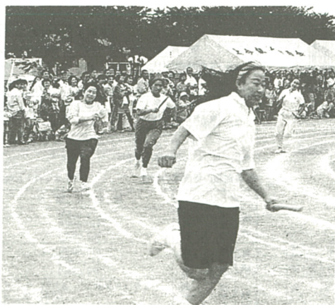
激しいレースを繰り広げたリレー(上星小学校で)

十月三日、十日、十七日、二十日、二十四日の四日間、市内大会場で恒例の「市民レクリエーション大会」が行われ、約六千人の市民がスポーツの秋を満喫しました。