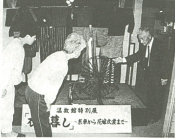
昔の衣服や糸車を展示