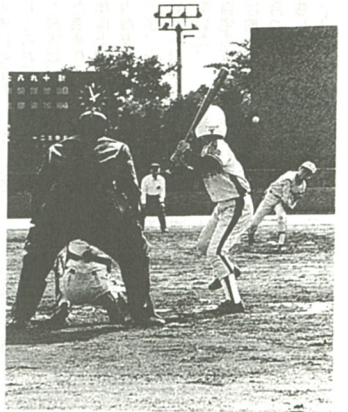
両チームの熱闘が続く