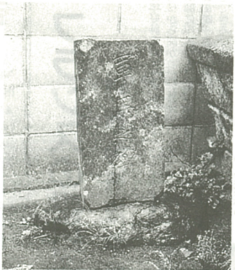
正覚寺にある軍馬の碑