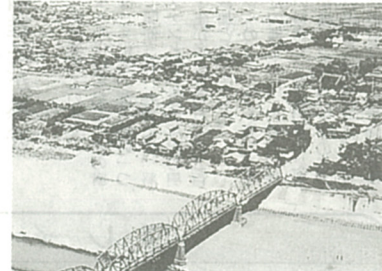
「じょう橋」大正2年に架けられた「じょう橋」

もうこのころは、土橋ではなく板橋で、六、七月ごろ撤去した。その橋材は、大山街道が堤防を切り通す東北隅に