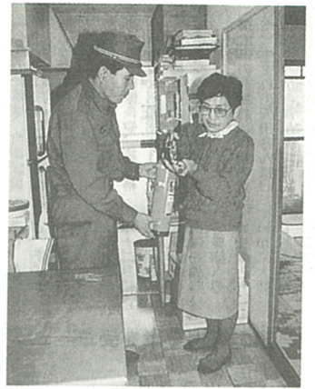
点検済ませ安心してお正月を...