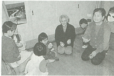
お手玉遊びって楽しいね