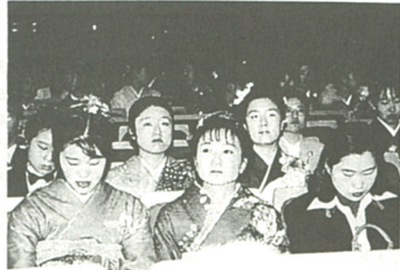
夢と希望あふれる新成人