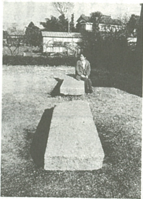
海老名館の敷石の一部は温故館庭園のベンチに...

昭和四十五年、海老名町教育委員会発行の「郷土の史料」に、「当時、その居館の玄関まで敷きつめられていた踏み石は大きい花崗岩で、しかも十三枚が敷かれ、いかにも堂々たる鎌倉時代の武家の居館を偲ばせるものであった。この敷石は明治の初期頃まであったが、今は全く散逸して、僅かに敷石が各地に遺されている……」