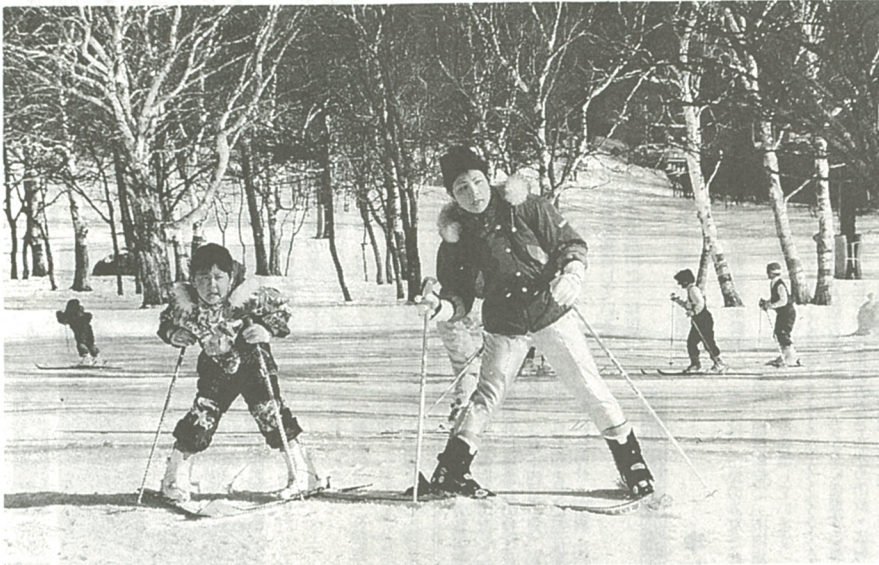
▲家族連れでにぎわう白樺高原国際スキー場

長野県立科町にある市民休暇施設「えびな蓼科荘」では、二年目のスキーシーズンを迎え、万全の準備で市民のみならずのおいでをお待ちしています。えびな蓼科荘の周辺には、スキー、スケート、わかさぎ釣りなど、家族連れでも楽しめる場所がたくさんあります。この冬、あなたもウィンドウスポーツにチャレンジしてみませんか。