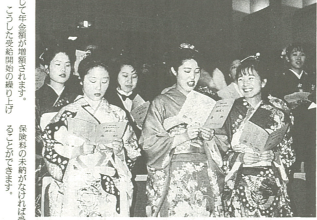
20歳になったらあなたも年金加入者です(成人式会場)

第2号被保険者は、職場の年金制度に加入しますが、第1号被保険者と第3号被保険者の加入は、届け出をしなければなりません。届け出をしなかったり、遅れたりすると、将来年金を受けるための資格を得ることができなくなることがあります。また、就職、退職、結婚など人生の節目には、加入者の種類が変わることがあります。