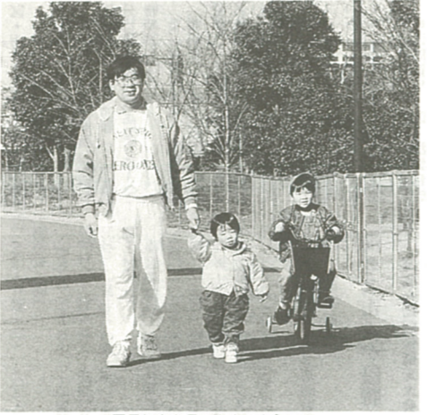
国民年金を長い人生の支えに!

年金制度が変わります 今年5月に1度の国民年金・厚生年金保険の財政再計算の年にあたります。その目的は、世代間のバランスを考え長期的な安定を図ることで、現在、国が見直し作業を行っています。その結果がわかり次第、広報でお知らせします。