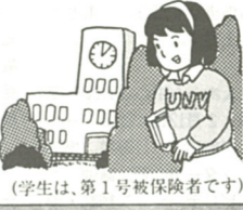
(学生は、第1号被保険者です)