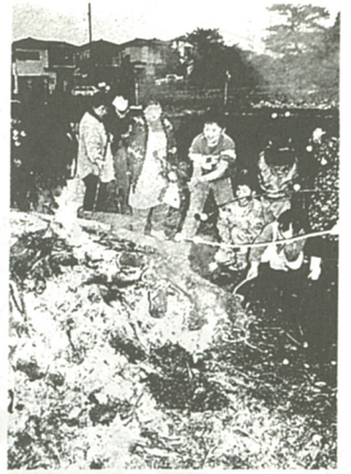
だんご焼けたかな...