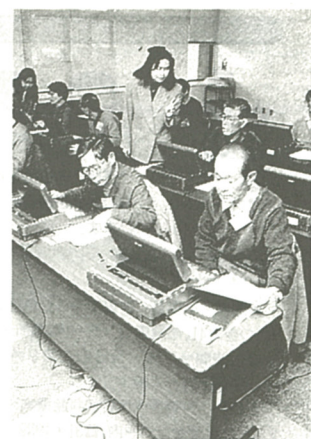
入力・編集技術を学ぶ参加者