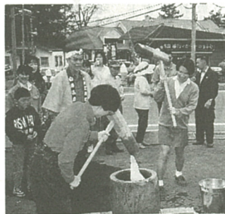
「すすらん祭り」のもちつき大会(去年撮影)

このほかにも、立科町民俗資料館やシャワーの宝庫の白樺湖などがあります。六月五日(日)には、白樺高原すすらん祭りが開かれます。蓼科山開き、蓼科牧場開きに続き、子供樽まし、かがみ開き、もつぎ大会などの楽しい催しがいっぱいです。また、すすらん開運の駒のプレゼント(各千人)もあります。祭りの問い合わせは、白樺高原観光案内所(☎0267・556201)へ。