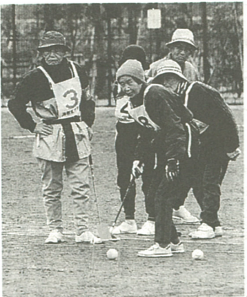
健康で生きがいのある生活を...

市では、まちづくりの目標のひとつとして「健康福祉都市」の実現を掲げ、すべての市民のみなさんが生涯にわたって健康で、安らぎと生きがいのある生活を営めることができるよう努めています。