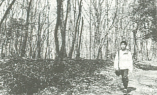
公有化された自然緑地

市では貴重なみどりを守り、良好な生活環境を確保するために、緑地機能や景観に優れた自然緑地の買い取りを平成四年度から行っています。【買い取り第一号地は、上今泉秋葉台】市では、住宅地の中にまぎらわすために、約三千五百三十坪(約五平方メートル)を買い取り、自然緑地として整備しました。このため市では、緑化推進計画を策定し、みどりを守り、創り育てる事業を進めています。緑地の買い取り事業は、この計画の重要な施策のひとつに位置づけられています。