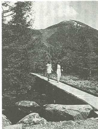
高山植物を見ながら森林浴も…

四季それぞれに、また、時間によつてさまざまな顔を見せてくれます。湖畔の散策では、高い丘の上にある白樺高原牧場を遊歩道歩きながら探索することができます。