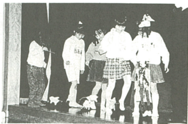
完成させた操り動物で遊ぶ児童たち