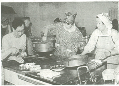
食事づくりの後は楽しい会食が...

毎月一回、市の公共施設などで「配食サービス」(昼食を楽しむつどい)を開催しています。参加者からは、「日ごと、ひとり暮らしで楽しみつつも、食事は作るのが大変で、このサービスは、本当に助かりました。」という感想も聞かれました。 【参加費】 一回当たり二百円 【問い合わせ】 高齢福祉課(内線)へ。