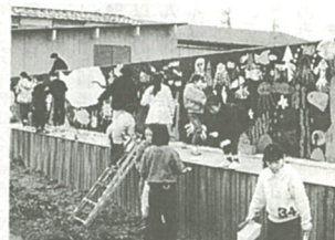
みんなで描いた海中の世界

分で作成できるほどの上達ぶり をみせた。 「ワープロのプリンターから 自分で打った原稿が印刷されて 出てくると紙が一番美しい。こ れからは手紙や文書作成にもワ ープロを使っていきたい」と と、参加者たちは話していた