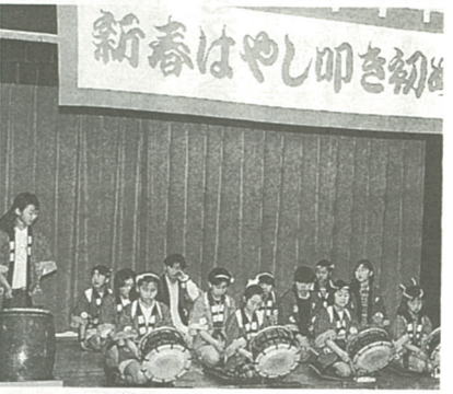
新春はやし叩き初め

市はやし保存連絡協議会が主催、市教育委員会が共催して、協議会に加盟している市内十七団体が一堂に集って繰り広げる新春はやし叩き初めを開催します。当日はゲストとして地域婦人