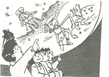
になりまし た。澄んだ夜空を見上げる、冬の代表的な星座が輝いています。教育センターのプラネタリウムで「冬の星空」のうちゆう(宇宙)の七人きょうの七人を見て、夜空で確かめ

市教育センターでは、冬休みも「冬休みプラネタリウム教室」を、次の日程で開催します。日冬寒くなり、星の観察には最高の季節(33・777)。