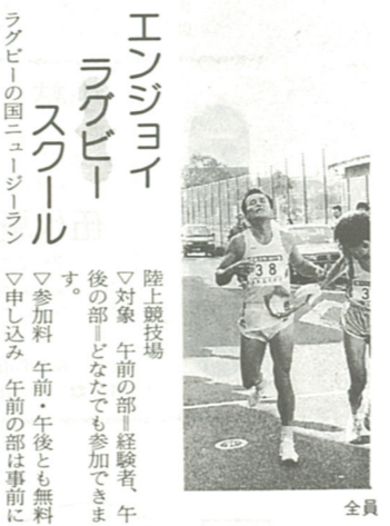
の力がタスキでつながる