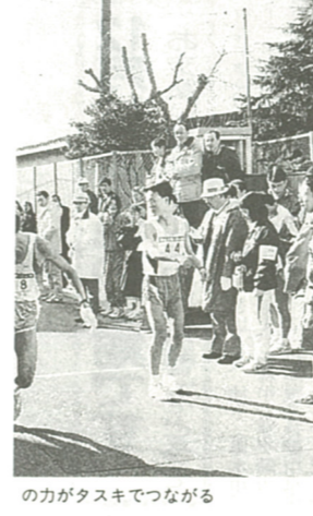
の力がタスキでつながる