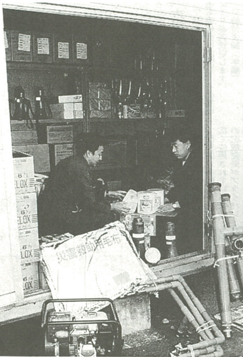
発電機の試運転など備蓄倉庫内の防災物品を点検