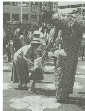
会場では足長おじさんの姿が...

南側の駐車場・芝生広場を会場に「展示・販売部門」「広場・ステージ部門」の2部門に分かれて開催されます。