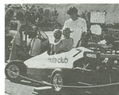
フォーミュラカーも登場

実行委員会では、祭典のシンボルキャラクターをプリントしたTシャツを作成しました。サイズはMとLで1枚700円で現在、生涯学習課で販売しています。ご希望の方は同課(内687)へお問い合わせを。