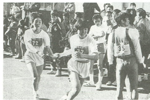
*えびな新春の風物詩、さて栄冠は?(今年の大会から)