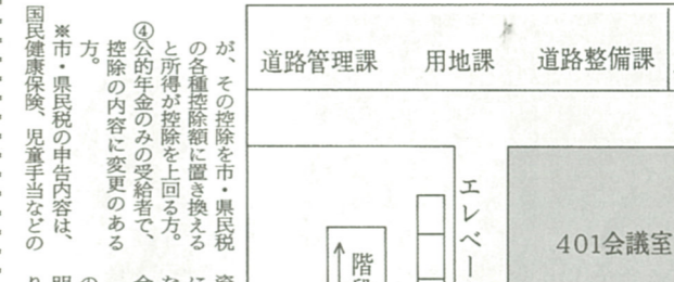
◆市役所受付会場(4階)