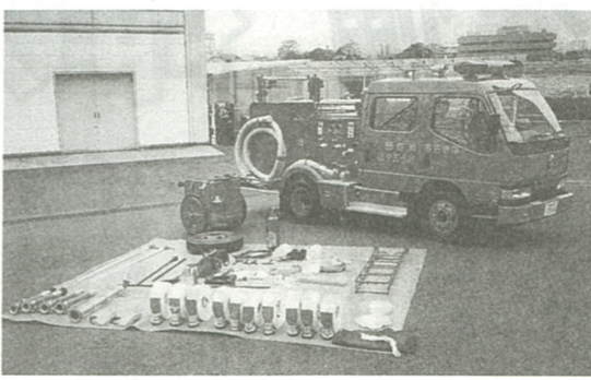
配属された最新型消防ポンプ車と装備の積載品

市消防団 下今泉・杜家・中野・本郷地区分団(6・12・13・15分団)に最新型消防ポンプ自動車(CD1型)が配属されました。 配属式は、去る12月18日に消防庁舎で行われ、これからは消防の第一線で活躍します。主な特長は次のとおりです。 ① ホース延長用資材積載可能 ② ホース10本積載可能 ③ 広範囲にホースを引込める(ホースの取り出しが便利) 報用カセットブレーキの取り付け(4) オイル循環式真空ポンプ搭載