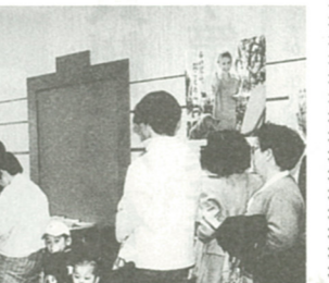
3月に入ると混み合います。お早めに

還付申告に必要な書類 還付申告をされるには、次のような書類が必要となりますので、前もってご用意ください。 ①源泉徴収票(給与所得・退職所得) ②医療費の領収書(年分ごと、病院ごと)に集計し