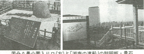
国分八景公園入り口(右)と「湘南の渡船」の説明板・景石

「龍峰寺八景詩」の説明板と景石を配置 今里庭球場(今里2丁3、今里自治会館)は、改修工事がこのほど完了し、グラウンドとなり、砂入り人工芝のコートになりました。 また、1月15日(日)から供用を開始します。ご利用ください。 ▽申し込み方法 通常の申し込み方法と同様ですが、利用申請は1月16日から1月18日までで、また窓口での申し込みは、抽選日が前月(16日)より受け付けを行います。4月分以降は、通常どおり1月15日の抽選日申込みとなりますので、ご注意ください。