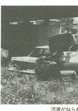
河原がねらわれている

最近、自動車や粗大ごみなどの不法投棄が目立ち、まちなかの生活への被害や景観を損ねてきています。 市では、その不法投棄の防止対策として、投棄されやすい地域について、県と合同による監視パトロールを行い、防護柵の設置、看板など不法投棄防止の啓発を行っています。不法投棄防止のために、皆さんの目が大切です。現場を目撃しましたら、通報をお願いします。 最近、自動車や粗大ごみなどの不法投棄が目立ち、まちなかの生活への被害や景観を損ねてきています。 市では、その不法投棄の防止対策として、投棄されやすい地域について、県と合同による監視パトロールを行い、防護柵の設置、看板など不法投棄防止の啓発を行っています。不法投棄防止のために、皆さんの目が大切です。現場を目撃しましたら、通報をお願いします。