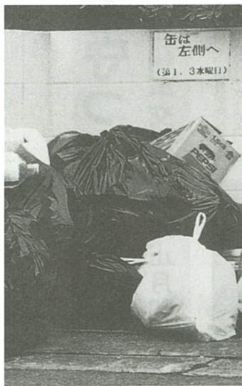
YES → 申し込み or 持ち込み NO → 不燃物 or 可燃物

人口増加、社会、経済情勢等の変化に伴い、廃棄物の量は増大し、質的にも多種多様化してきています。廃棄物の増加がこのままの増加分で続け、処理施設、最終処分場、処理費用に大きな影響をもたらしてきます。 排出される廃棄物の中には、まだまだ資源として再利用できる有価物が多数あり、廃棄物の減量化、再資源化に努め、限られた資源の保護、環境保全のため、次の事業など積極的な取り組みを行っています。 不用品交換制度 主に粗大ごみ、あるいは、引越し等で不用となった物の中で、まだ十分に使用できる新品同様のものを、その物を出された方へ譲渡する。譲渡料は、引越料の一部として、引越業者を通じて行われます。 資源回収事業 ごみの減量化と資源再利用を目的として、自治会、子供会、PTA、婦人会など、市内の各種団体が、紙、布、金属、びん類などの回収を定期的、かつ継続的に実施しています。 市では、昭和58年度から資源回収を行う団体に登録していただき、回収報告書などに基き、その回収量、回収回数に応じて集団資源回収実施奨励金を交付しています。