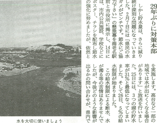
水を大切に使いましょう