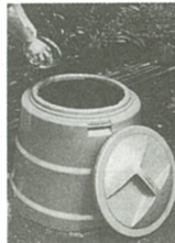
千300世帯で設置活用

対象者は、市内在住の労働の方で、利用時間は月1回、金曜日の午前9時から午後4時までで、交換は先着順とします。用品は、一応の点検はしますが、その品質を保証すること、また、欠陥等によって生じた損害を賠償することはありません。 家庭用コンポスト 生ゴミ処理容器 補助事業 生ゴミは、家庭から出る燃やさないの約2割を占めています。この生ゴミを焼却しないで堆肥化(コンポスト)して平成5年度から「コンポスト」の購入助成を行っています。 5年度 70世帯90基 6年度 27世帯30基 7年度 27世帯30基 対象者は、市内に住所を有し、現在居住している容器設置可能な方で、1世帯2容器までです。平成8年度は、30基の助成を実施します。(詳細は、今後、広報紙や回覧等でお知らせします)