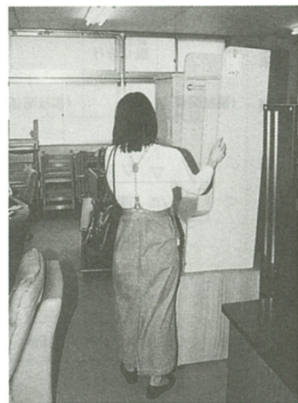
これなんか、まだ使えそう

対象者は、市内在住の労働の方で、利用時間は月1回、金曜日の午前9時から午後4時までで、交換は先着順とします。用品は、一応の点検はしますが、その品質を保証すること、また、欠陥等によって生じた損害を賠償することはありません。 家庭用コンポスト 生ゴミ処理容器 補助事業 生ゴミは、家庭から出る燃やさないの約2割を占めています。この生ゴミを焼却しないで堆肥化(コンポスト)して平成5年度から「コンポスト」の購入助成を行っています。 5年度 70世帯90基 6年度 27世帯30基 7年度 27世帯30基 対象者は、市内に住所を有し、現在居住している容器設置可能な方で、1世帯2容器までです。平成8年度は、30基の助成を実施します。(詳細は、今後、広報紙や回覧等でお知らせします)