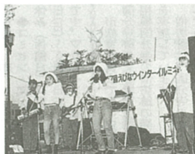
点灯式ではバンド演奏も…

☆期日 12月7日(土) ☆点灯式催し物 ▷アマチュア団体による野外ライブ▶時間 午後2時～6時30分(ただし午後5時～5時30分は除く)▶出演団体 IRR EGULER、LANDSCAPE、OFF BEAT UNIT、SANTAN、中央農高和太鼓同好会、キューティーズ ▷もつ煮・たる酒などの無料配布▶時間 午後3時30分～ ▷イルミネーション点灯式▶時間 午後5時～