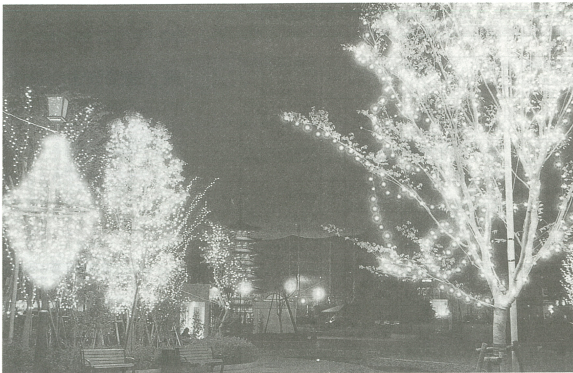
冬の夜空に輝くイルミネーション(去年の中央公園)

冬の夜空を美しく彩るイルミネーションが今年も12月7日から来年1月15日の間、海老名中央公園に点灯されます。期間中は、午後5時から午前0時まで(元旦は朝5時まで)点灯します。約4万個の電球が公園内の樹木などに飾られ、夜空の星を背景に浮かび上がる、さまざまな色の光の競演が幻想的な世界を演出します。ぜひお立ち寄りください。