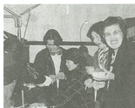
とん汁のサービスで体も温まる