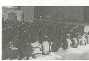
今泉中学校での薬物乱用防止対策講話

このように恐ろしい薬物に少年が汚染されないよう、海老名市内でも、小・中学校で薬物乱用防止についての薬物防止教室や座間警察少年相談員による薬物乱用防止講話などを開催しています。