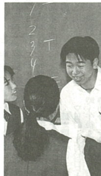
納豆、とろろは食べられない。日本酒は熱かんならOKです

日本の中学生の印象は? 「幼い感じがする。アメリカの同世代の方が何事も主体的にこなしているし、自立しているかな」