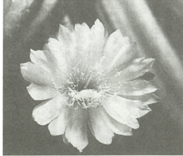
次の開花が待たれる鬼面角

学名のケレウスは、ギリシャ語であり、ラテン語あつて「ろうそく」の意味から形の特徴を表したものとされています。自生地は、アルゼンチン、ブラジル、ペルーなどの南米ですが分布は極めて広く、耐寒性があつて関東以西の暖地では露地栽培ができ、接ぎ木台木にもよく使われています。(参考…伊豆シャボテン公園編者「サボテン楽しみ方・育て方のコツ」ほか)