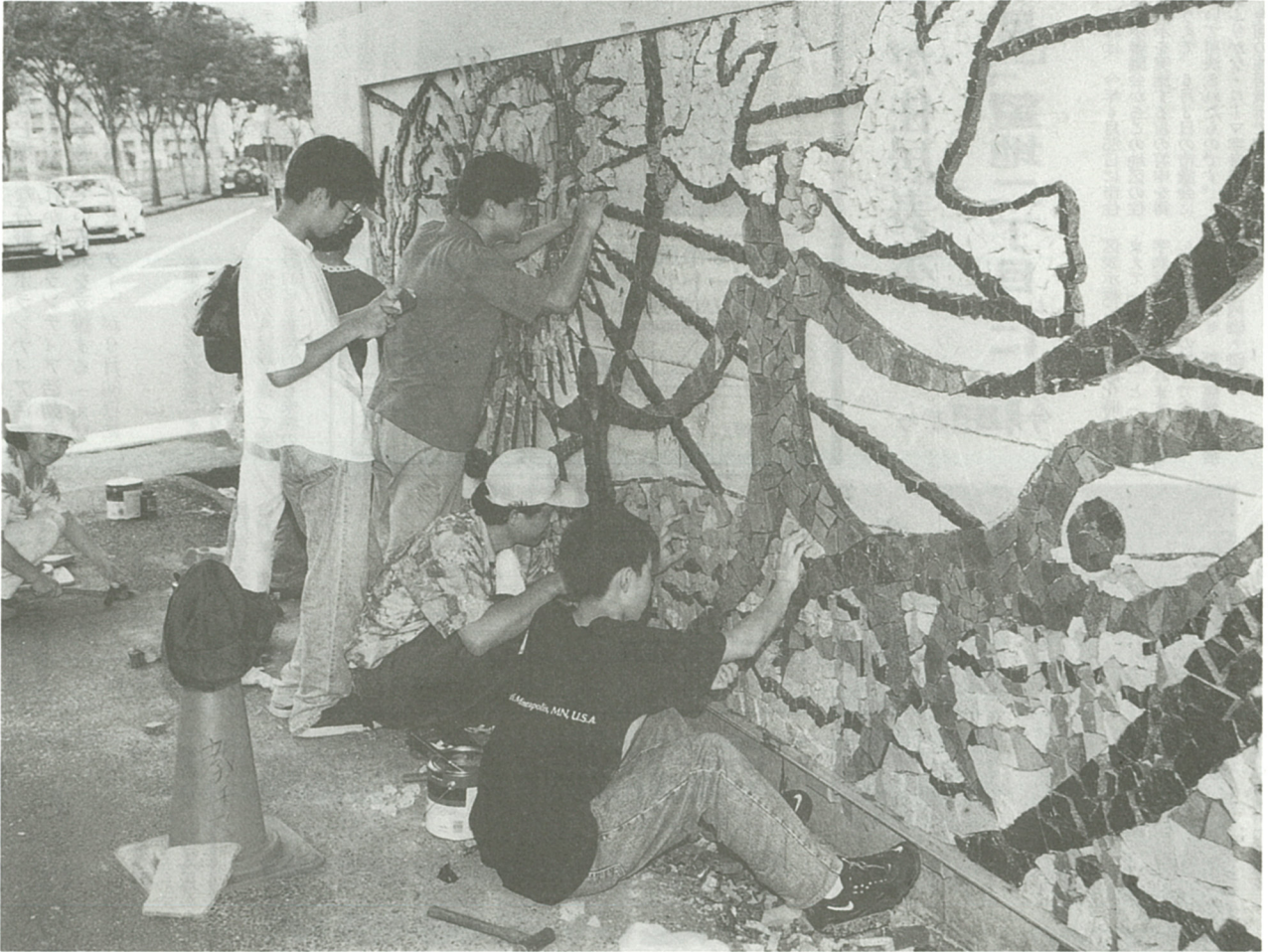
「日陰で風通しがよく、思ったより作業しやすかった」と生徒たち。