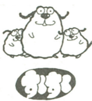
すくすくのマスコット

先月からオープンした子育て支援センター「愛称すくすく」(愛称すくすく)・中野田保育園併設では、就園前の子どもたちへの保育の相談等を受け付けているほか、施設者の交流の場として「すくすくサロン」を開放しています。 このシリーズでは、同センター職員が経験の中から子育てに役立つ「豆知識」を紹介していきます。