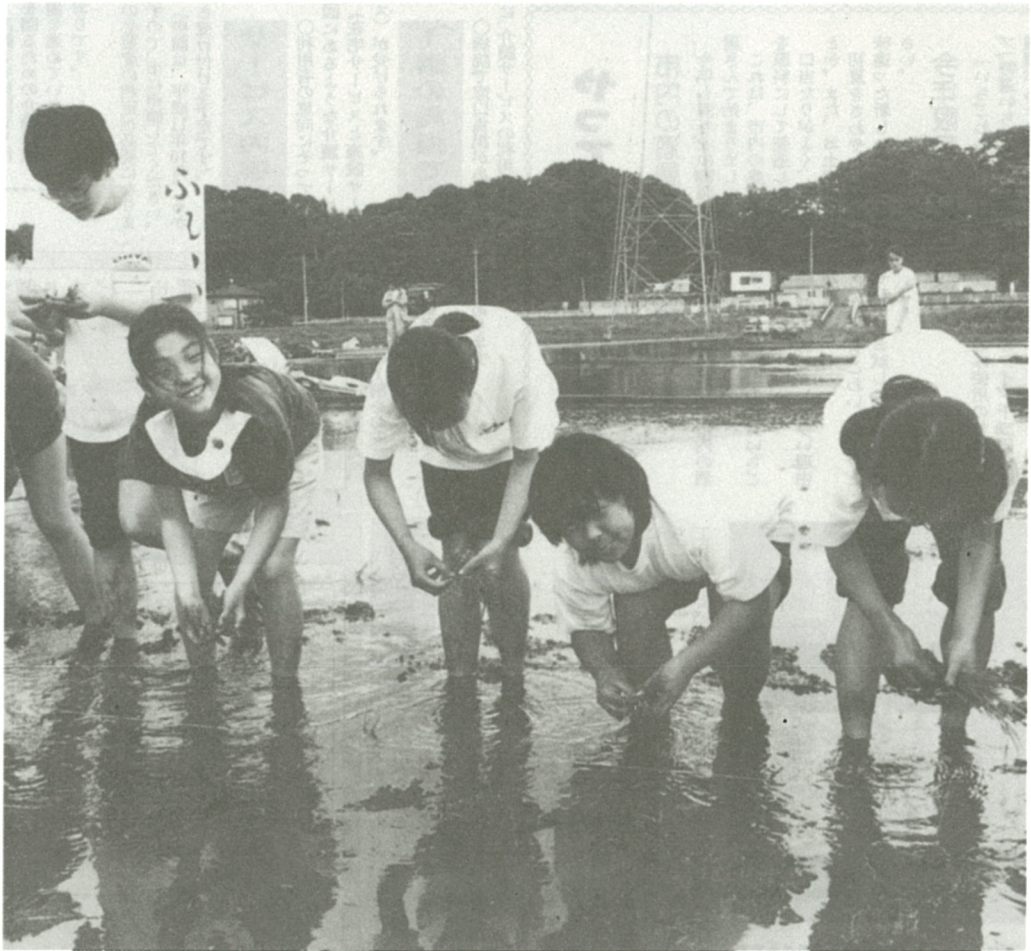
学校創設以来行われている「ふれあい米作り」の田植え