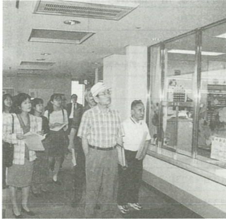
わかば会館を見学するモニターの方々

れている貴重なものです。空調設備のない建物のため、発掘された本物は5月いっぱい展示された本物は5月いっぱい展示されています。 この記事が掲載される頃は残念ながら見ることができません。レプリカ・複製品は常設展示。12月頃にまた展示されるということなので、是非発掘された本物も足を運んで見て頂きたいと思えます。 次は、今年4月に運営が市から社会福祉協議会に委託されたわかば会館です。高齢者及び身障者のデイ・サービス事業を行っている施設です。 その後、私たちがお話しになっていた資源分別回収組合と美化センターを見学しました。両