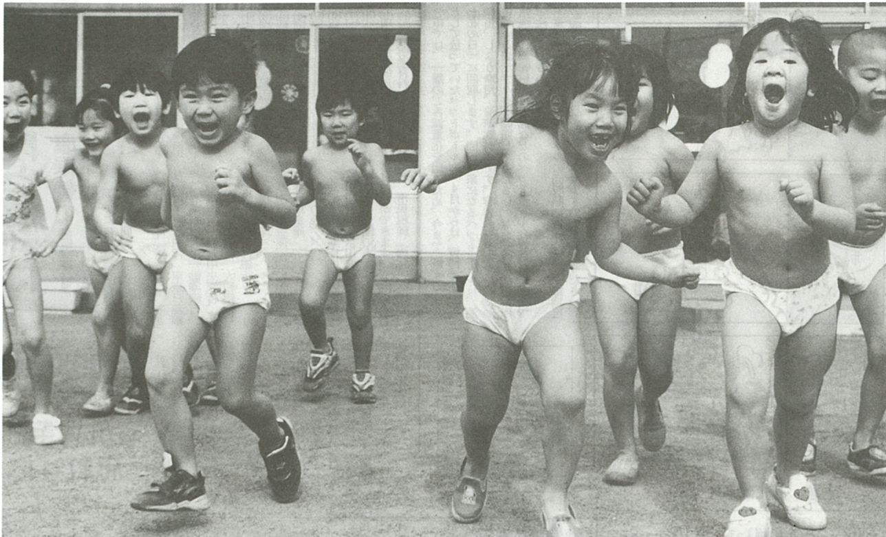
▶ 歓声をあげて外にかけ出す園児たち (勝瀬保育園で)