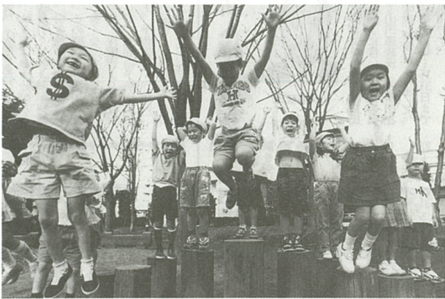
▲ 「寒くない!」と柏ヶ谷保育園の園児たち (東柏ヶ谷近隣公園で)