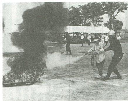
「つけた火はちゃんと消すまで あなたの火」

母子・父子家庭の方で、次のいずれかの条件に該当する方は、住宅手当を受けることができます。 (1)配偶者のいない方で、20歳未満の児童を養育している方 (2)申請日を基準に、海老名市に1年以上居住している方 (3)本人の支払う家賃が月額2万円を超える方 (4)児童扶養手当受給資格者と同一所得限度額以内の方 ▽申請に必要な書類 申請書(民生委員証明が必要)、賃貸借契約書、家賃支払明細書(写)、印鑑および普通預金通帳 (写)申請方法 申請書は、3月9日(月)まで福祉課に配布していただき、申請は3月13日(金)までです。 ※住宅手当を受けた方は、申請は毎年必要です。去年申請した方でも、今年も申請してください。 ▽お問い合わせ先 福祉課(内線357)