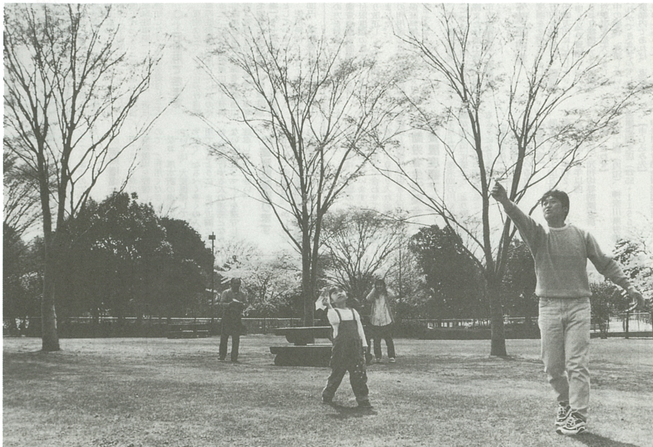
約4割が「豊かな緑が海老名の魅力」と回答(新緑が芽ばえ始めた海老名運動公園で)