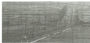
交通網の整備を望む声が...