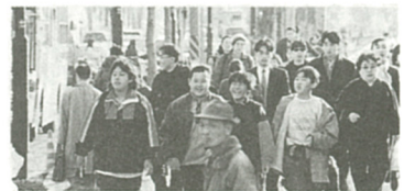
安心して住めるまちづくりを...