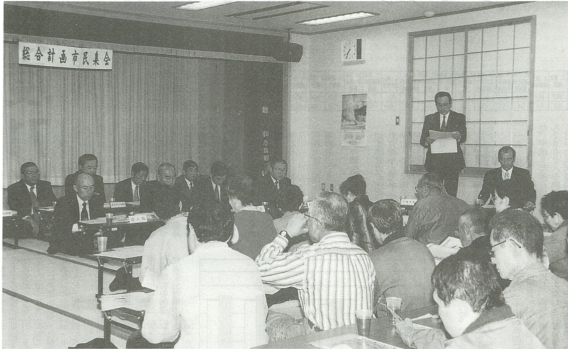
海老名市の将来に向けた貴重な意見が寄せられた市民集会 (社家コミセンで撮影)