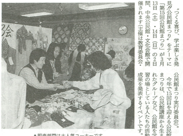
▲即売部門は人気コーナーです

UVAの喜び 学ぶ楽しさ 公民館まつり実行委員会 見方公民館まつりをテーマに「第15回公民館まつり」が3月13日(土)・14日(日)の2日間、中央公民館・文化会館で開催されます。主催は教育委員会、成果を発表するイベントです。