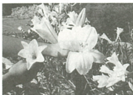
倍染色体のユリは花が巨大に(右側)

植物は細胞の中の染色体の数が倍になる(倍染色体)というところ、花が大きくなったり開花本数が増えたりします。細胞分裂の際にコルヒチンという薬品をつけることで、ユリの染色体数が通常の24本から、48本の細胞に分裂します。無菌状態で培養した苗にコルヒチンを処理したテッポウユリは、成長すると花径18・2センチ、通常の1・56倍の大きさの花を咲かせました。このユリの染色体を調べた結果倍染色体と分かり、新品種が作成できたと思います。」