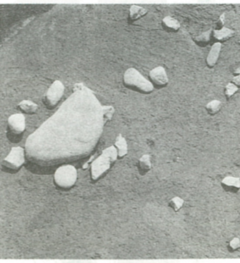
柏ヶ谷長ヲサ遺跡の発掘出土品