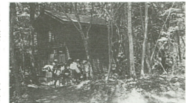
木立ちの中にあるバンガロー

夏の子約はお早めに 山梨県上九一色村にある野外教育施設「富士ふれあいの森」は、富士山のすそ野に広がる、豊かな自然とのふれあいが体験できる施設です。11月末までの開設期間に、ご家族や仲間同士で訪れて、大自然の中で過ごす時間はいかがですか。 上九一色村の春は、例年海老名より約1カ月遅れでやってきます。5月のはじめごろからソメイヨシノが咲き始め、それに続いて富士山の周りに咲かない富士桜も可憐な花を咲かせます。桜が散り始めるころ新緑の季節が来ます。やつと巡り来た春を愛しむように青々とした木々の歌が聞こえてきます。そしてこの季節は春の野草の季節でもあります。「富士ふれあいの森」の周辺には、クランノキやコシアブラなどを代表する山菜が芽吹いてきて食卓をにぎわす時期です。そんな「富士ふれあいの森」でアウトドアを楽しみましょう。 開設期間は? 海老名市野外教育施設「富士ふれあいの森」は、学校利用以外を一般(市在住・在勤・在学の方)に開放しています。すでに4月から7月の受け付けは開始していますが、4月15日からは、7月15日から利用する方の申込受付が始まります(市在住の方)。 同施設の宿泊は、バンガロー(11棟)かテントを利用する2つの方法があります。料金は表1参照。また、日帰り利用も可能です。宿泊収容人数は、バンガロー95人、最大130人まで、テント170人で、両方で最大300人まで利用が可能です。施設の開設期間は次のとおりです。 ①5月・10月・白樺り・宿泊とも毎日利用できます。 ②4月と11月・白樺りのみの利用で土曜・日曜および祝祭日に限って利用できます。 ③12月・3月・冬学期中は施設を閉鎖します。 ※なお、宿泊用の場合の宿泊数は、原則として3泊4日を限度とします。