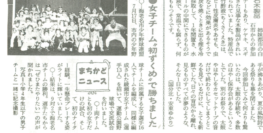
▲選手しっちゃた... 写真・小学4年生以下の男子チームと一緒に記念撮影