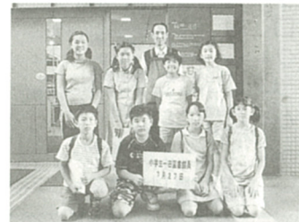
最後に笑顔でポーズ!