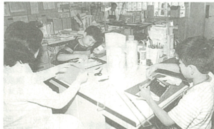
うまくカバーがかけられたかな