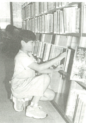
座ったり背伸びしたり大忙し