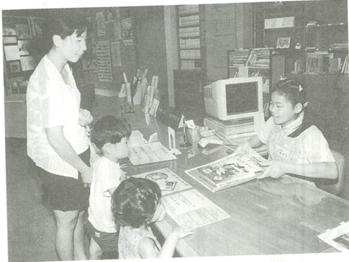
カウンターでの貸し出しを体験