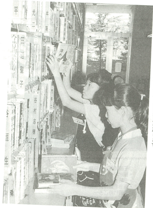
返却された本を元の場所に戻します