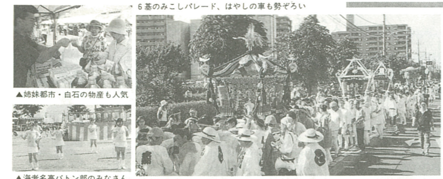
▲姉妹都市・白石の物産も人気 ▲海老名高バトンのみなさん ▲盆踊りも場内いっぱい ▲選手しっちゃた...