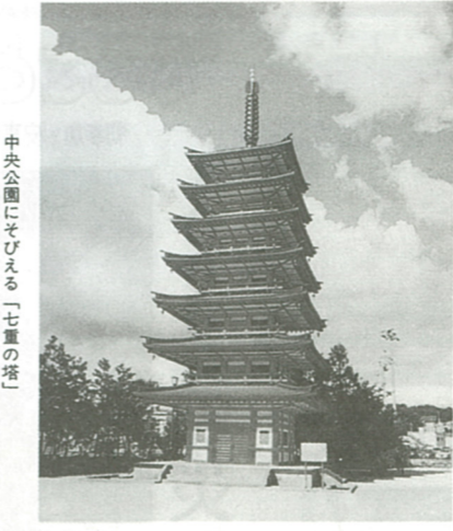
中央公園にそびえる「七重の塔」

市民憲章は、市制施行翌年の昭和47年、市民生活を明るく楽しい豊かなものとするため、だれもがよつとした心がけで守るべき規範を作ろうという趣旨で制定が企画されました。