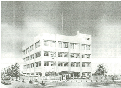
市役所東側に建設されます

市民のみなさんから要望されていた海老名警察署(仮称)庁舎の工事が今月から始まります。建設場所は、市庁舎の道を挟んだ東側です。 海老名市を管轄する警察署は、座間警察署でしたが、当市の人口増や市街地の進展により防犯・交通安全の強化から「海老名市に警察署を」との市民要望を受けて、市では果敢に決断を要する必要性が、かたがわ新総合計画21に平成13年開設と位置づけられました。 海老名警察署(仮称)は、平成13年春に完成する予定です。 ▽住所 海老名市大字高田2-1 ▽敷地面積 3335.6平方メートル ▽延面積 3609平方メートル 鉄筋コンクリート造地下1階地上4階建です。