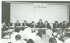
市民集会の会場風景

市では、平成3年度から22年度までの20年間の第3次総合計画を作り直しますが、来年度で前期10年間の計画が終了しますので、平成13年度(2001)から始まる後期基本計画を策定してまいります。これは、平成22年度(2010)までの10年間の計画です。