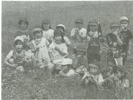
調和のとれた新時代の海老名を創る