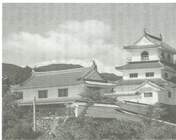
平成7年に復元された白石城