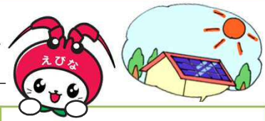
海老名市イメージキャラクター えび～にゃ

再生可能エネルギー等の有効利用の促進と低炭素社会の実現に向けて、環境に配慮した設備の設置・購入経費（リースも含む）の一部を補助します。