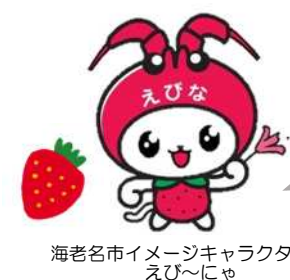
海老名市イメージキャラクター えび～にゃ

⇒ かかりつけの歯医者さんに相談してみましょう。 歯科医師への無料相談日も設けてます (月2回)。 TEL 231-8650 (えびな在宅医療相談室)