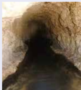
詰まりの原因になる油がこびりついた汚水管

下水道管の耐用年数は約50年といわれ、市の下水道管はまもなく50年が経過します。長く使うことで維持費用などを抑えることができます。食べ残しなどは台所などに流さず、指定のごみ収集日に出しましょう。