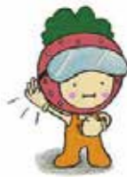
海老名市自殺予防対策キャラクター「こころくん」

3月～5月は自殺が多くなる時期といわれ、国は3月を「自殺対策強化月間」と定めています。「誰も自殺に追い込まれることのない社会」に向け、自身や周囲の人の心の健康に目を向けましょう。