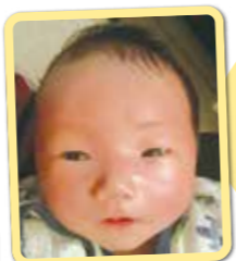
いっちゃん パパとママの たからもの! いっぱい遊ぼうね