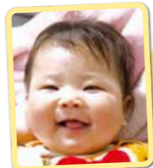
えまちゃん わが家の 天使です♡