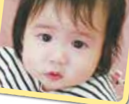
まりちゃん ハーブバスデー おめでとう!