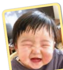
コトちゃん 2人の優しい お兄ちゃんが 大好き☆