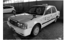
ワクチン号 (タクシー車両版)