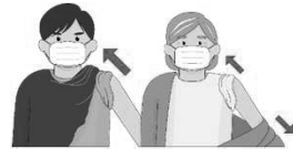
肩の出しやすい服装で来場を