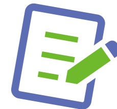
図 市民相談課 ☎(235)4567