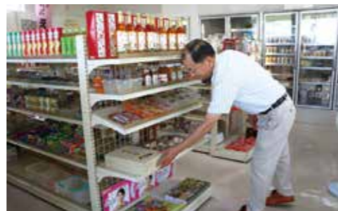
酒屋の店主の傍ら地域を守る役割も