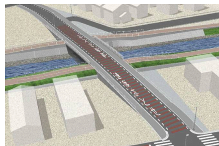
市道62号線延伸道路イメージ