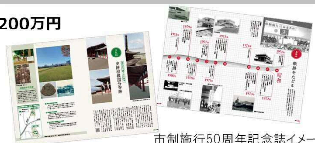
市制施行50周年記念誌イメージ

これまでの市の歩みや、歴史・文化、将来像、未来に向けたまちづくりなどの功績を記録に残し、後世に伝えるとともに、広くPRするため「市制施行50周年記念誌」の発行準備を進めています。