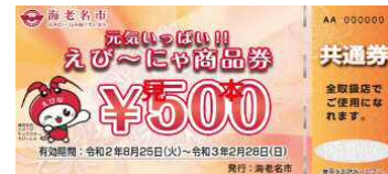
プレミアム付商品券(共通券)イメージ

新型コロナウイルス感染症の影響により、売上げが減少している市内事業者を支援するため、市内でのみ使用可能なプレミアム付商品券を発行しました。