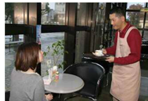
障がい者自立支援イメージ

障がい者の暮らしと自立を独自にサポートする「福祉法人」の設立に向け、準備会を設置し、検討を進めました。