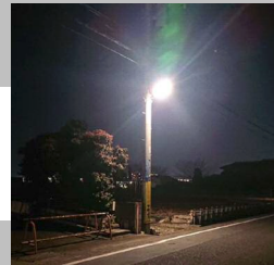
LED防犯灯のイメージ