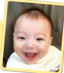
たいちゃん 笑顔はわが家の宝物!元気に育ってね!