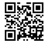
新型コロナウイルス感染症情報ページ

公共施設の開館状況や中止・延期になったイベント、市の取り組みなど、新型コロナウイルス感染症に関するさまざまな情報を随時お知らせしています。