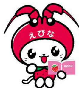
海老名市イメージ キャラクターえび~にゃ