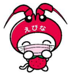
海老名市イメージ キャラクターえび~にゃ

Please wear a face mask and wash your hands ♪